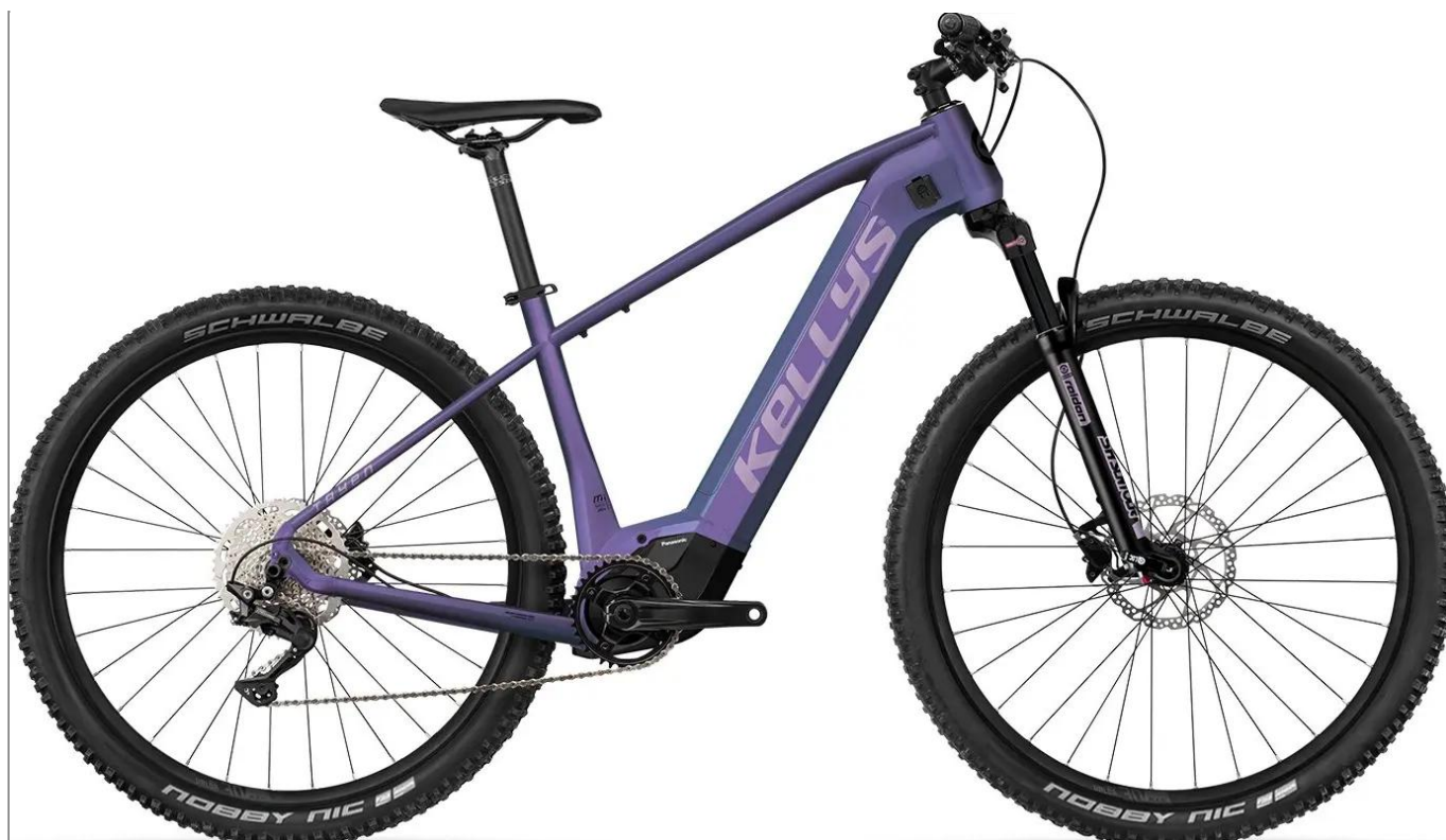
Kellys Tayen – dopasowana geometria dla 27,5" i 29"