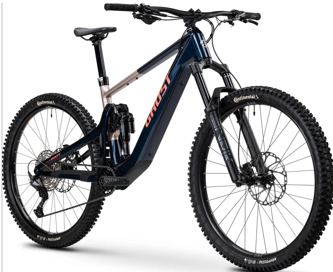
Ghost Path Riot CF Advanced – kolor granatowy