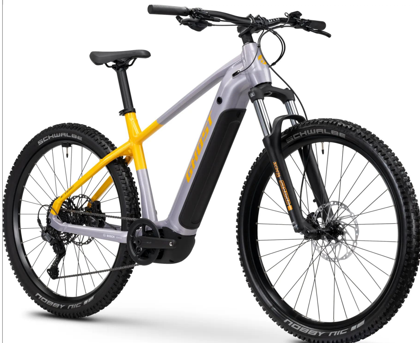
Ghost E-Teru Universal - kolor Gray

Wszechstronny e-hardtail do turystyki górskiej i rekreacji. Wersja Universal w kolorze Gray oferuje nowoczesny Smart System od Bosch, silnik Performance Line CX (85Nm) oraz geometrię zoptymalizowaną pod kątem komfortu.