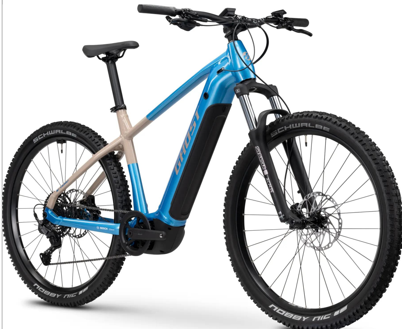
Ghost E-Teru Universal - kolor Blue

Uniwersalny e-hardtail do turystyki górskiej i rekreacji. Wersja Universal oferuje nowoczesny Smart System od Bosch, silnik Performance Line CX (85Nm) oraz geometrię zoptymalizowaną pod kątem komfortu w kolorze niebieskim.