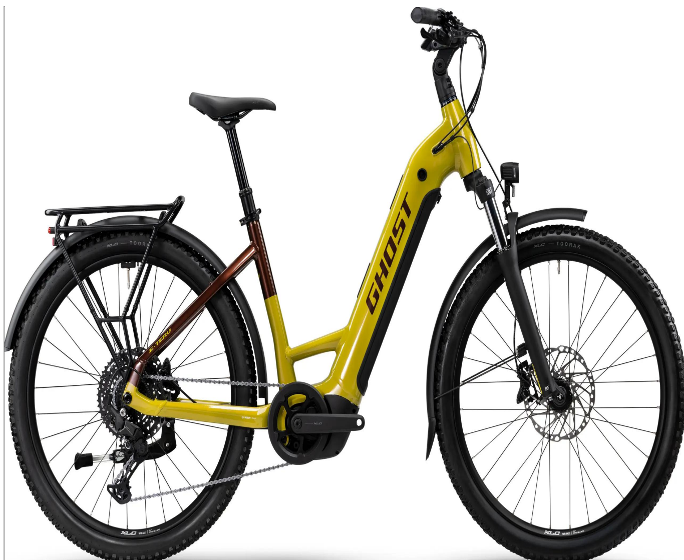
Ghost E-Teru Universal EQ Low - kolor Yellow