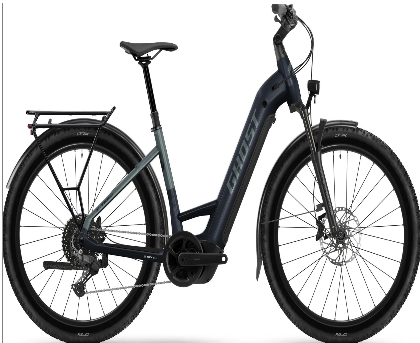
Ghost E-Teru Universal EQ Low - kolor Blue