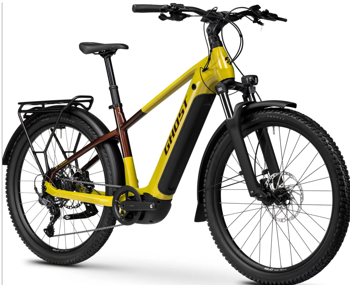
Ghost E-Teru Universal EQ - kolor Yellow