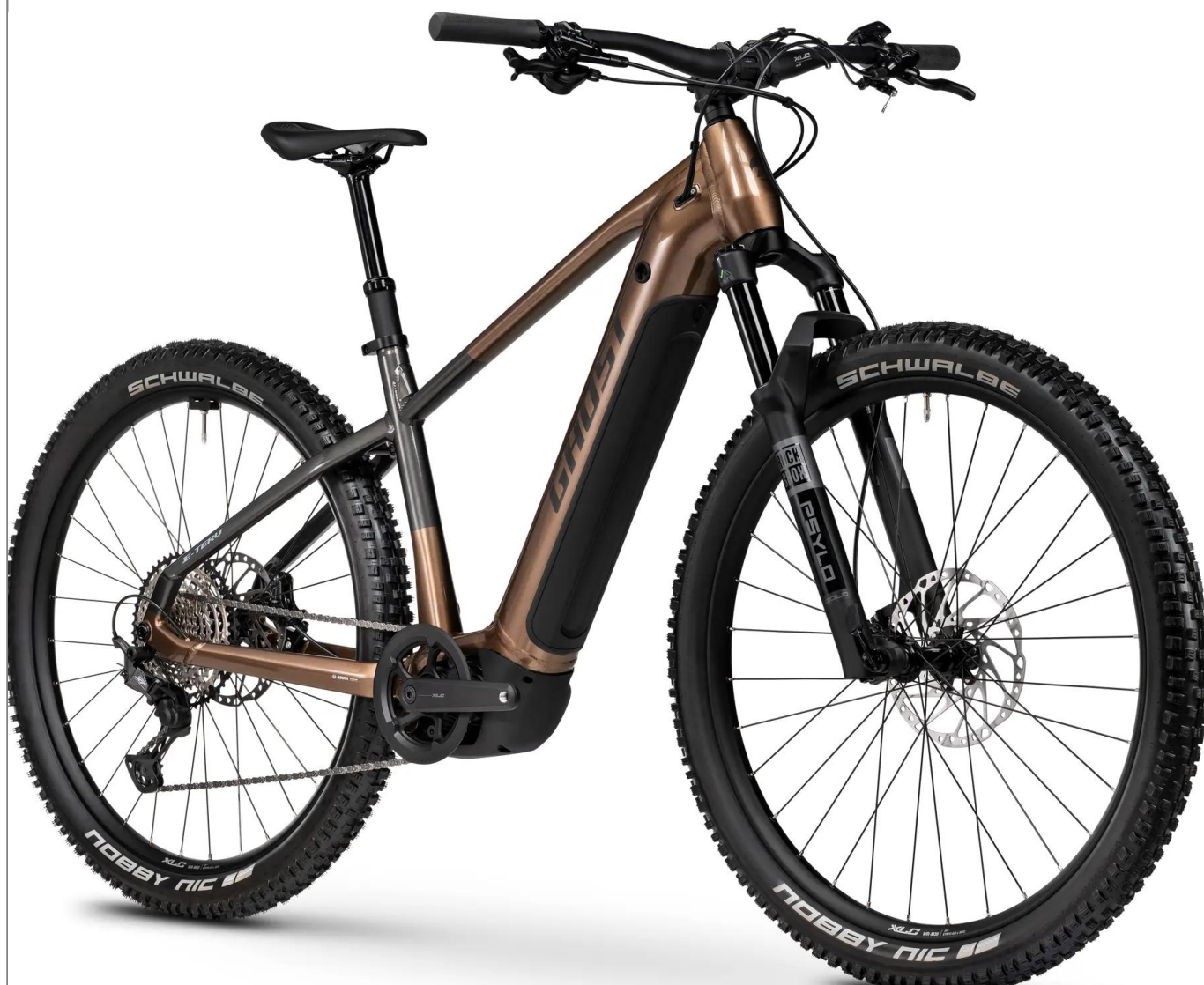
Ghost E-Teru Pro - kolor Copper

Zaawansowany e-hardtail do wymagającej turystyki górskiej. Model Pro w kolorze Copper oferuje potężny silnik Bosch CX, rekordowo pojemną baterię 800Wh oraz system Size Split, optymalizujący rozmiar kół i geometrię ramy dla każdego wzrostu.