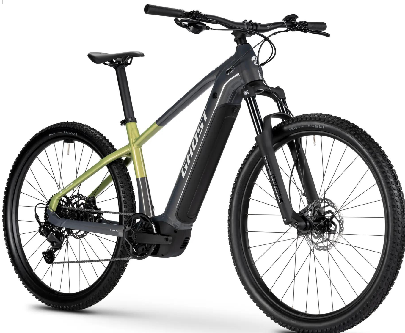
Ghost E-Teru - kolor czarny

Wszechstronny hardtail e-MTB zaprojektowany do komfortowej turystyki górskiej. Wyposażony w silnik Bosch, baterię 540Wh oraz system Size Split, który dopasowuje rozmiar kół (27.5" lub 29") do wielkości ramy w kolorze czarnym.