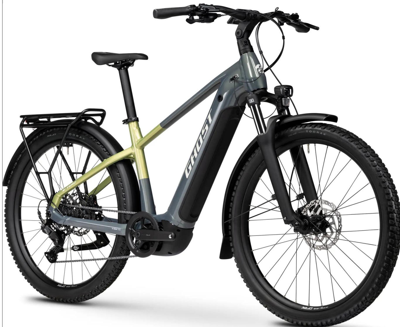
Ghost E-Teru EQ High - kolor czarny

Wszechstronny e-bike typu SUV na klasycznej ramie "High". Model EQ (Equipped) łączy terenowe geny hardtaila e-MTB z pełnym wyposażeniem turystycznym, oferując silnik Bosch CX oraz koła 27.5" dla maksymalnego komfortu i stabilności pod obciążeniem.