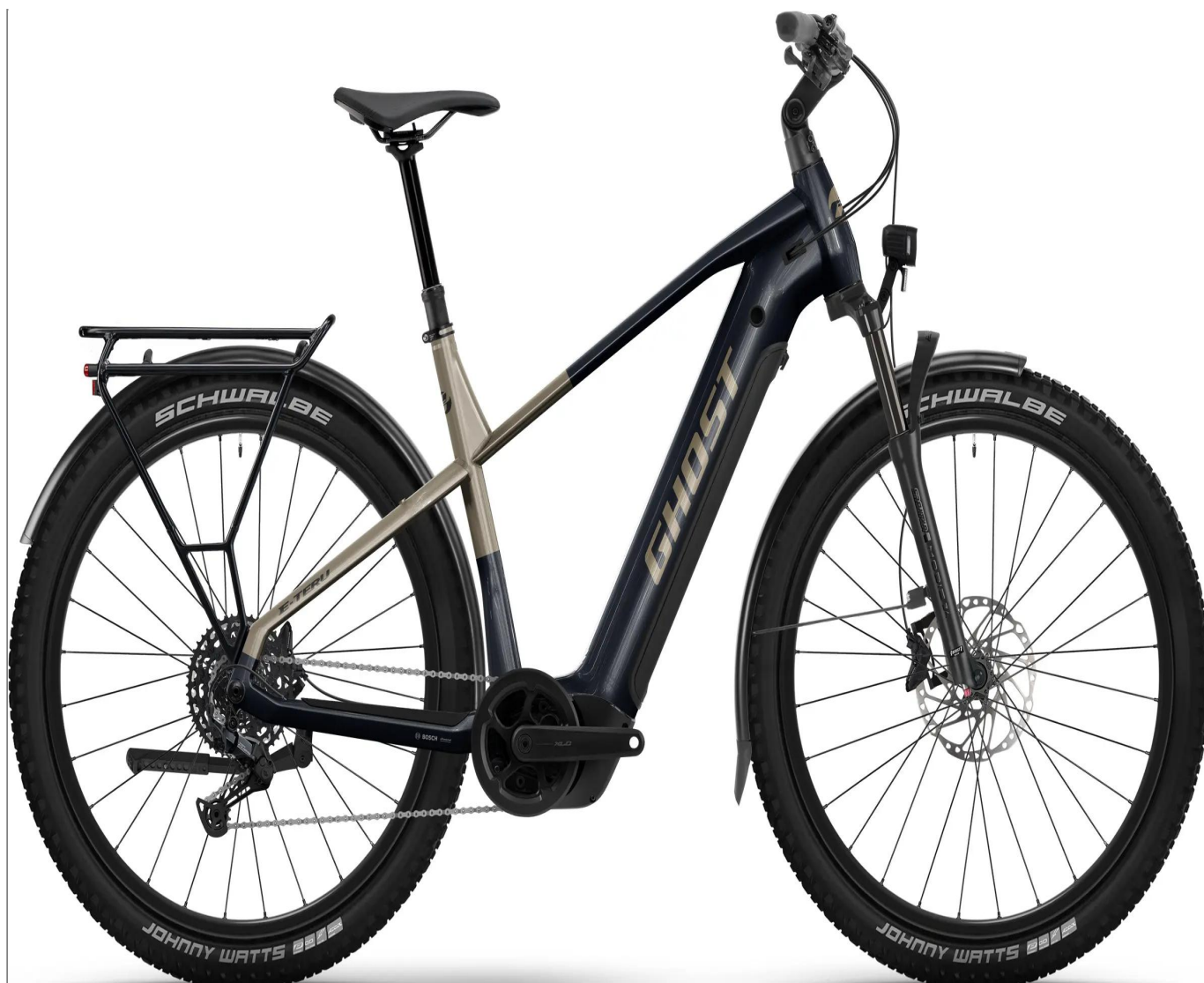
Ghost E-Teru Advanced EQ - kolor Black