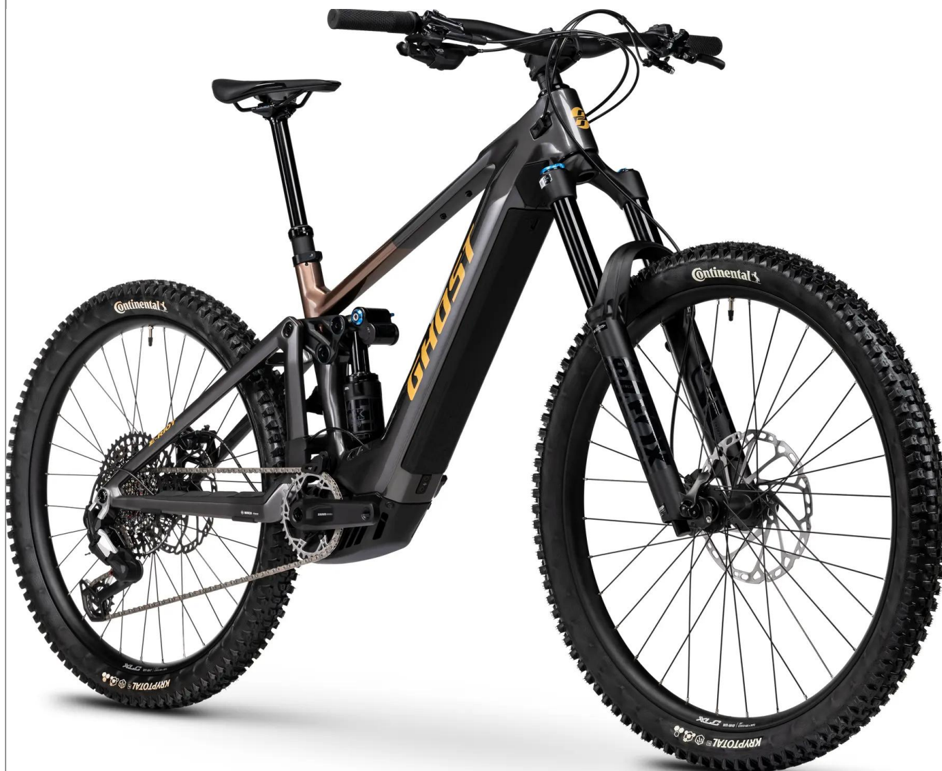
Ghost E-Riot CF Pro 2026 - kolor czarny

Wyczynowe Enduro e-MTB z karbonową ramą, skokiem 170/160mm i geometrią Mullet. System Bosch CX 85Nm oraz progresywna geometria tworzą maszynę gotową na najtrudniejsze trasy świata.