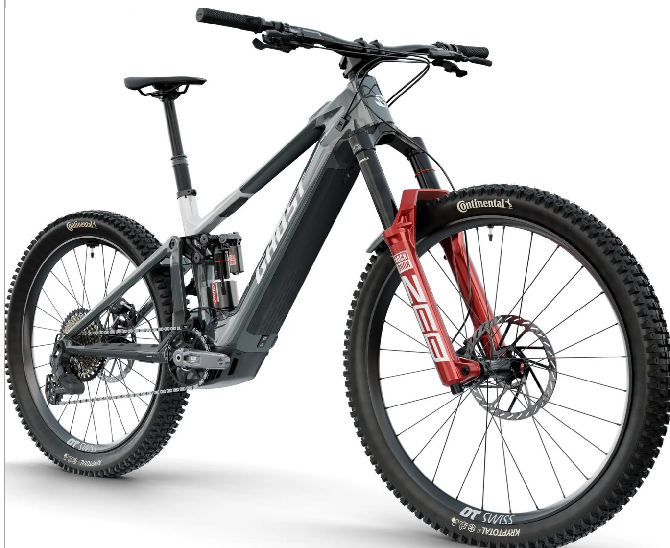
Ghost E-Riot CF Full Party 2026 - kolor Mist Blue

Flagowe Enduro e-MTB z silnikiem Bosch CX-R (Race), geometrią Mullet, karbonową ramą i skokiem 170/160mm. Maszyna stworzona do wygrywania w najtrudniejszym terenie.