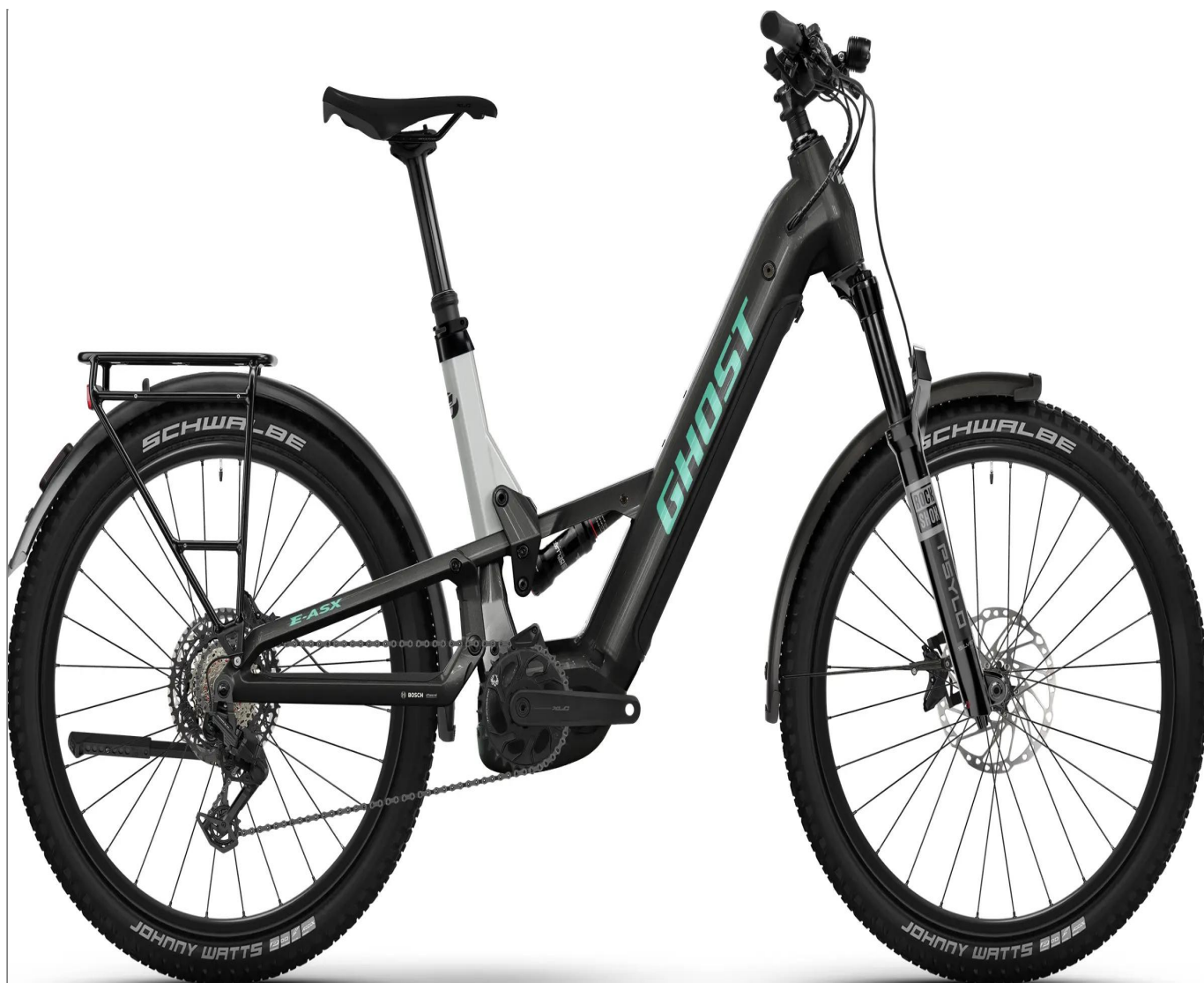
Ghost E-ASX Universal Low EQ - kolor czarny