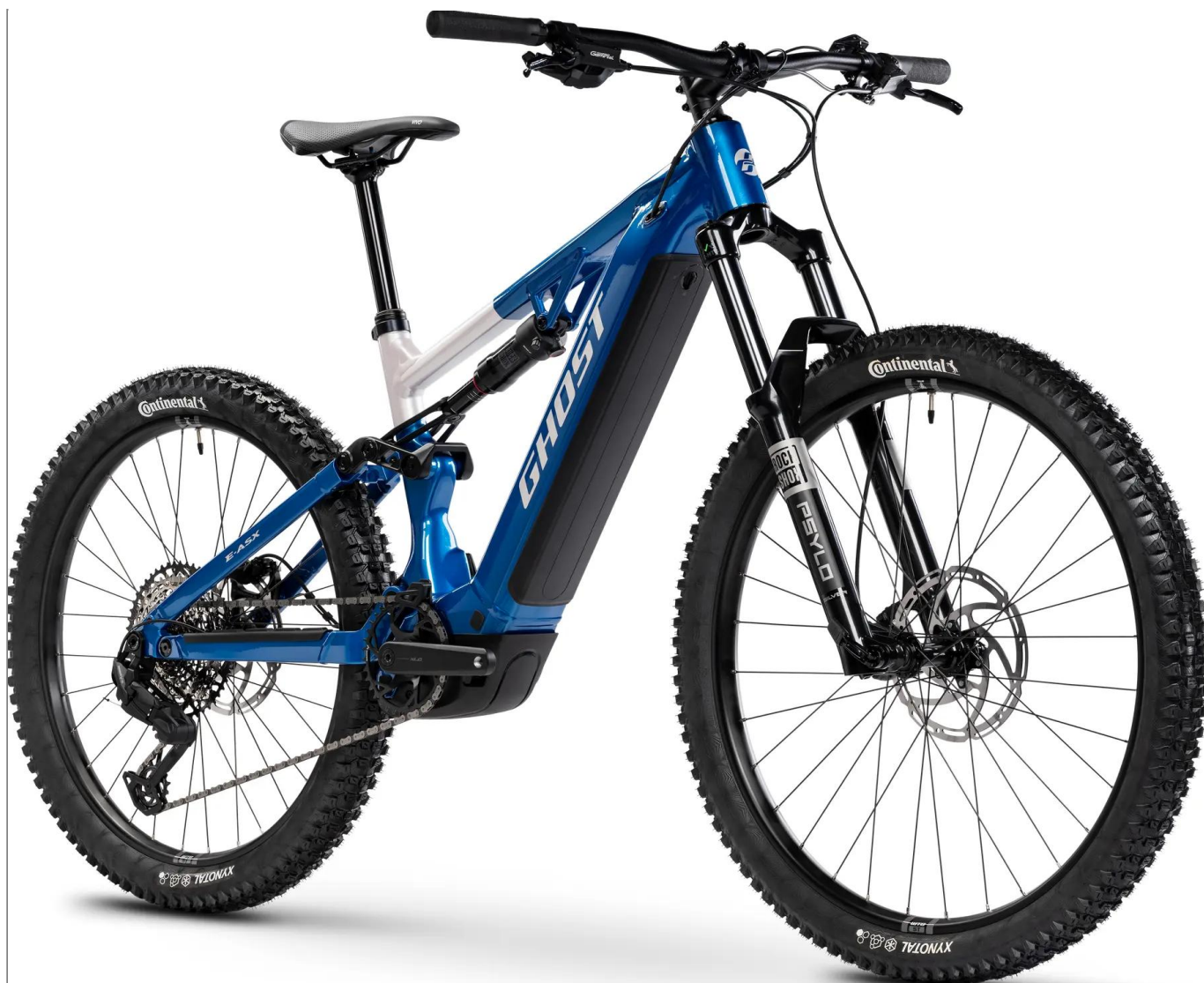
Ghost E-ASX Universal 2026 – kolor niebieski