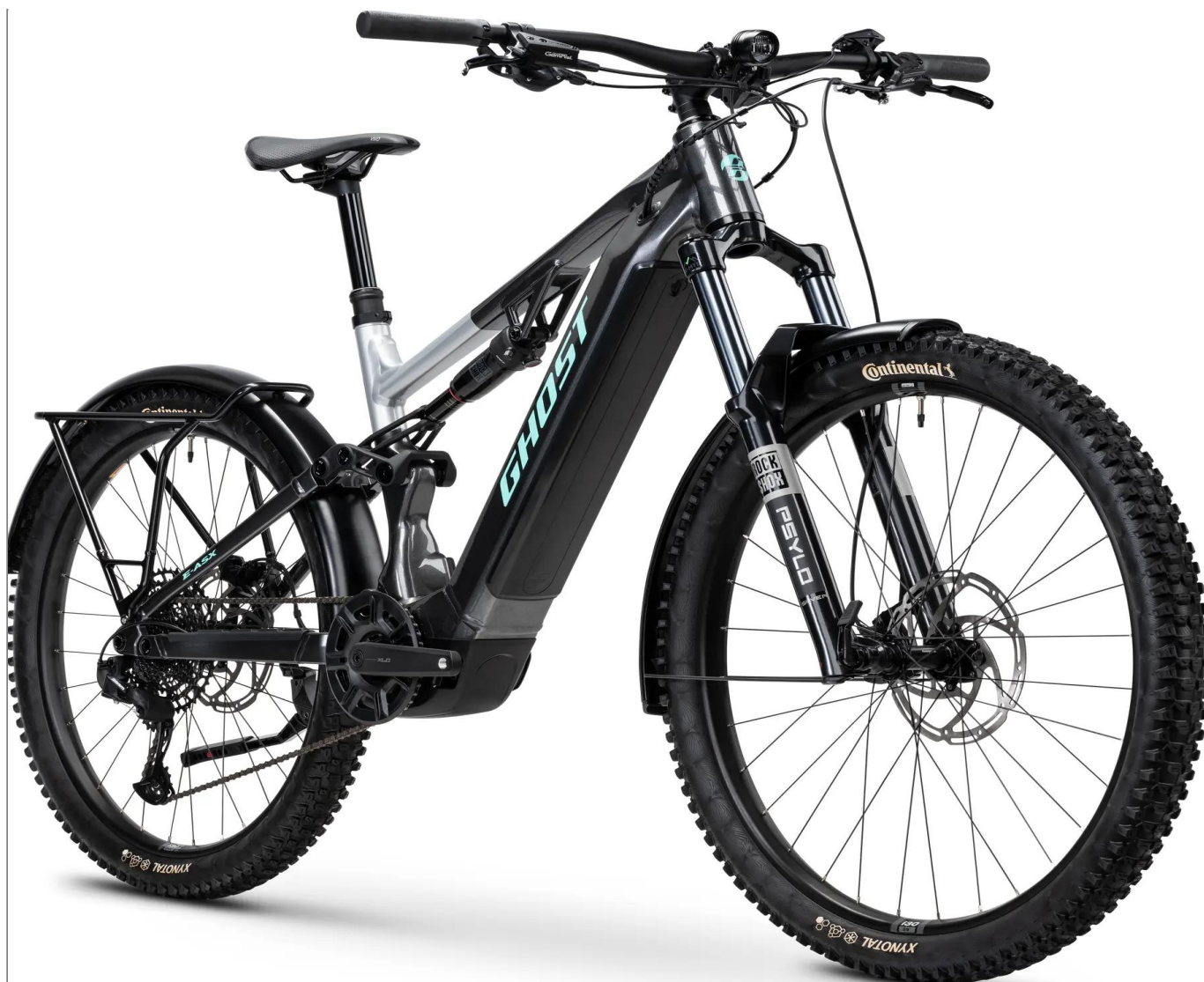
Ghost E-ASX Universal High EQ - kolor czarny