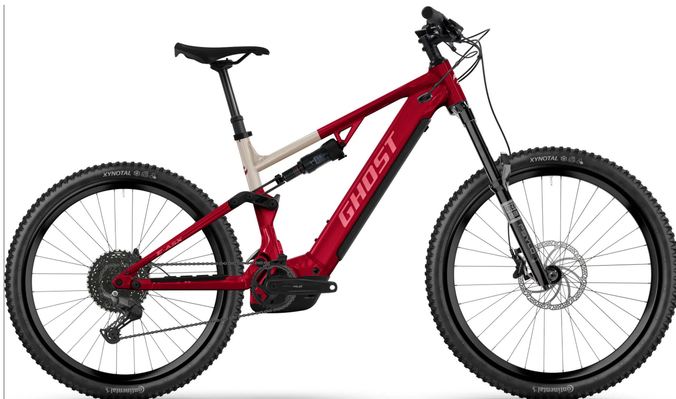
Ghost E-ASX Essential - All Mountain E-MTB