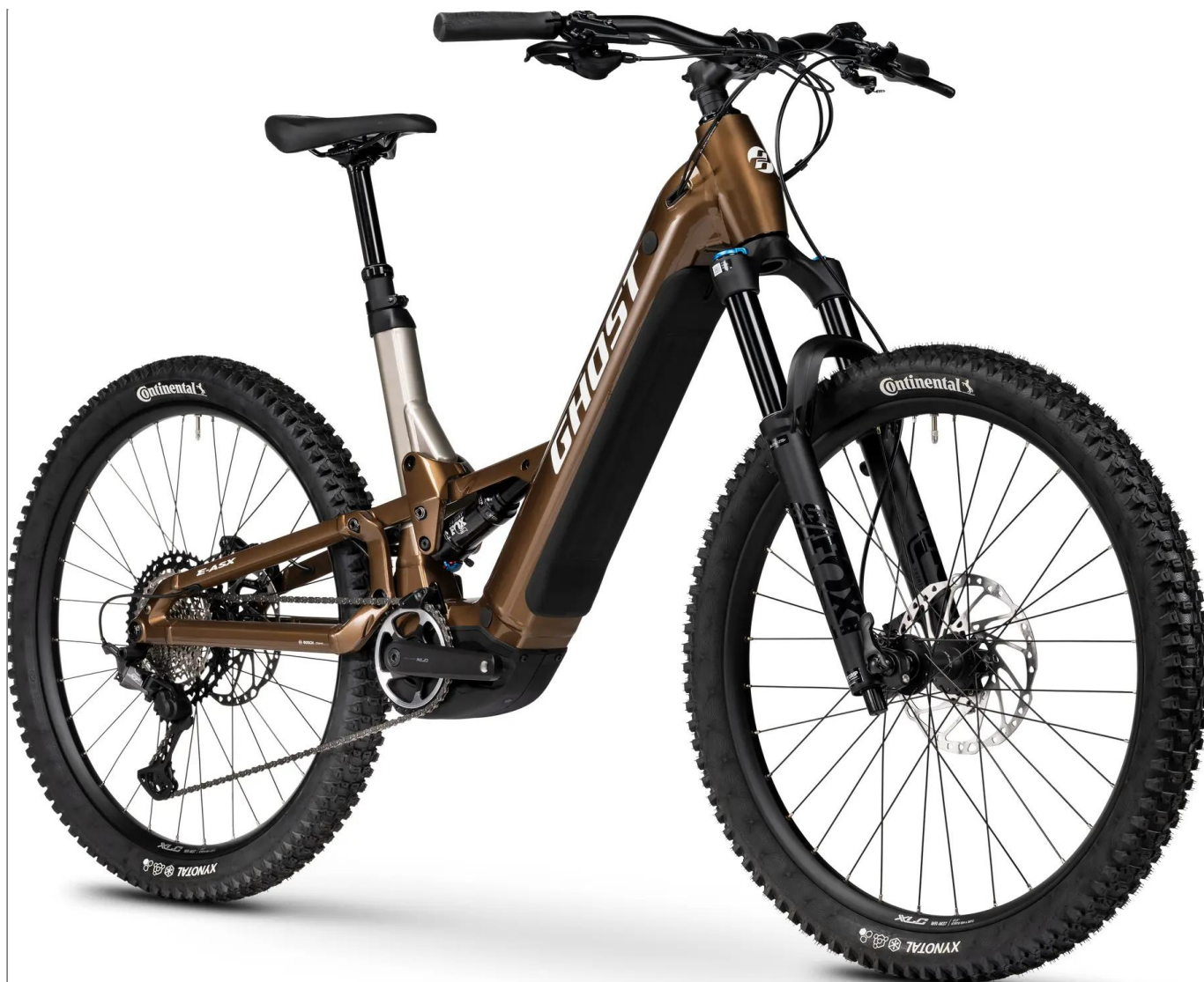
Ghost E-ASX Advanced Low 2026 - brązowy