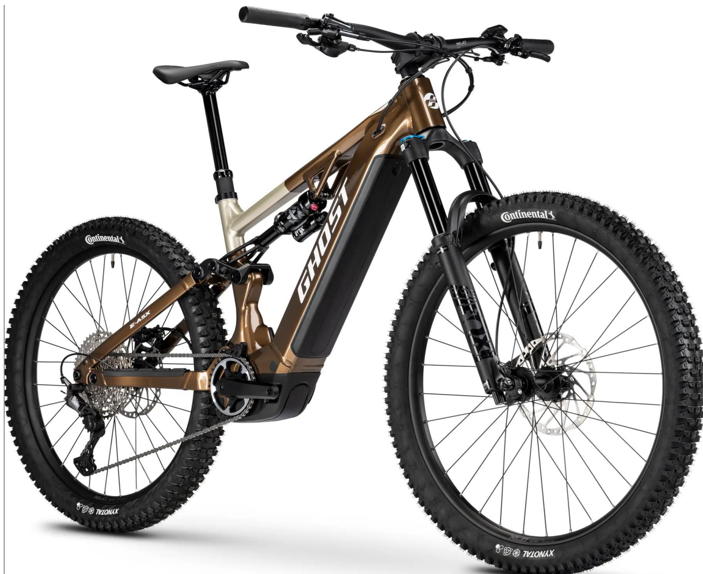
Ghost E-ASX Advanced 2026 - kolor brązowy