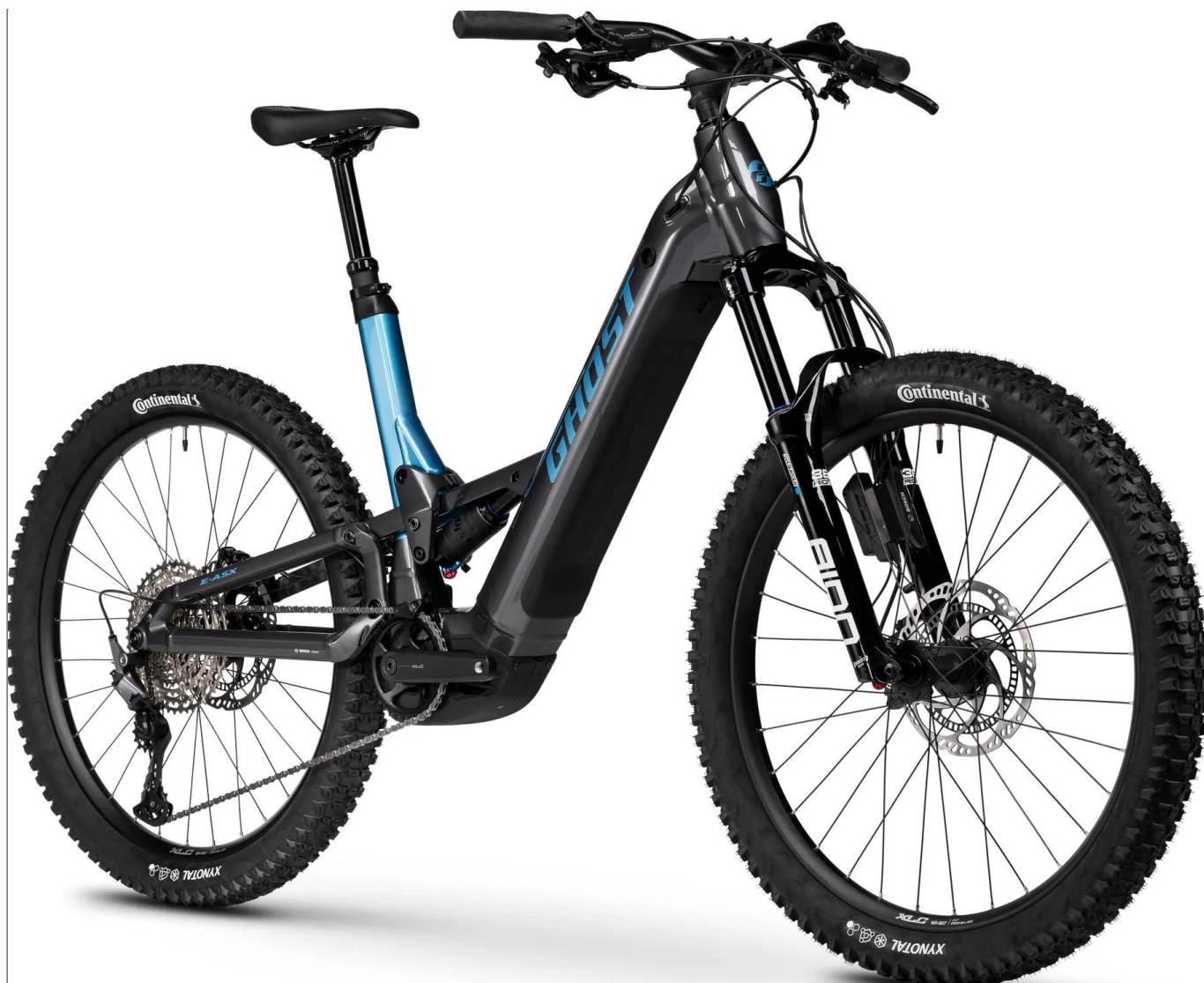
Ghost E-ASX ABS Low 2026 - kolor Slate