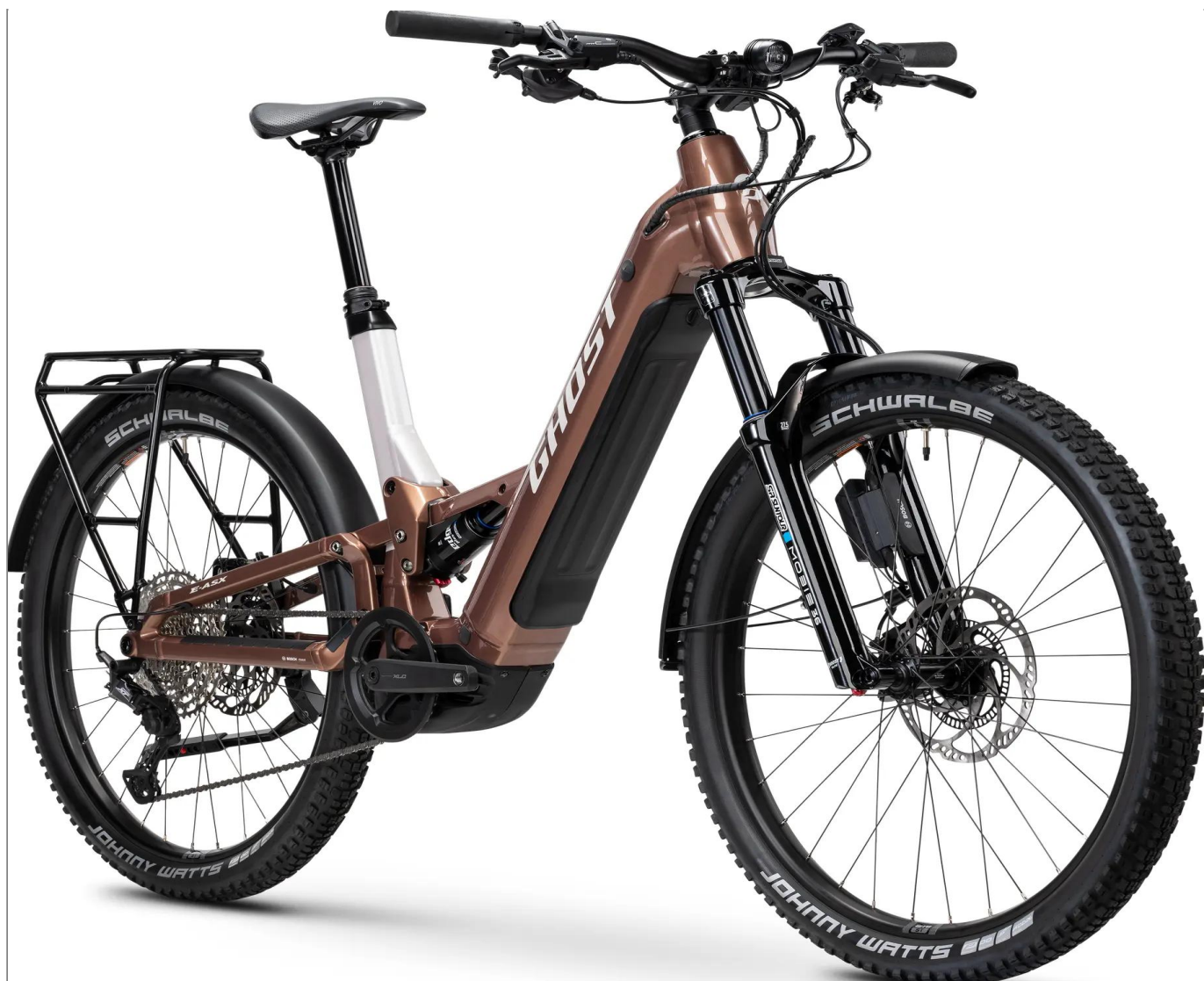
Ghost E-ASX ABS Low EQ - kolor Coffee