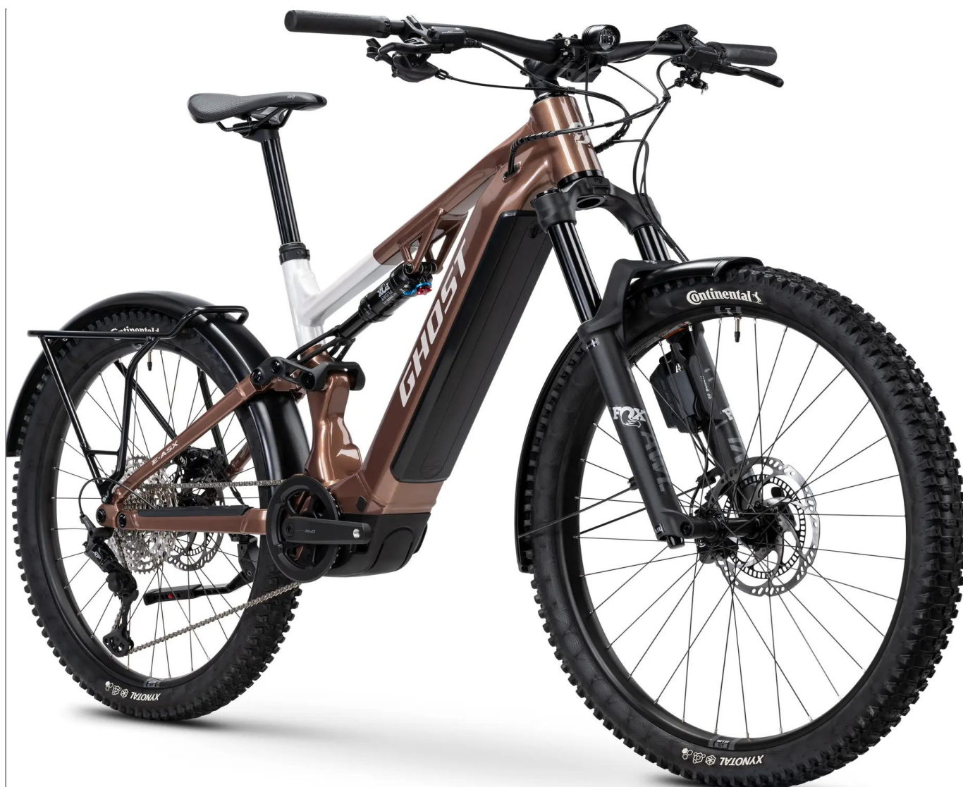
Ghost E-ASX ABS High EQ - kolor Coffee