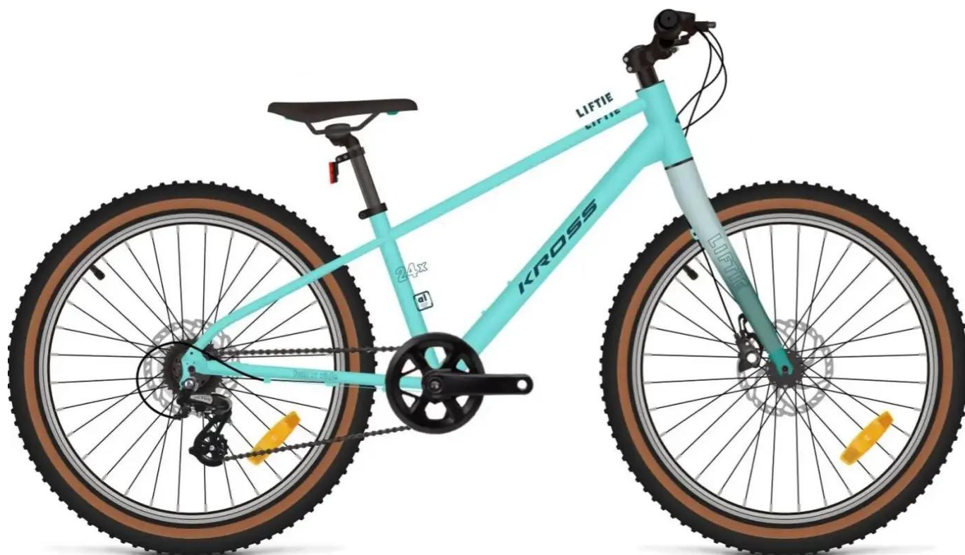
Zdjęcie zastępcze, przedprodukcyjna wizualizacja, zdjęcia studyjne niebawem

Model Liftie 24 X to nie tylko niska waga, ale przede wszystkim bezpieczeństwo klasy premium. Wyposażony w profesjonalne hydrauliczne hamulce tarczowe Tektro HD-J2920 z dźwigniami o skróconym zasięgu oraz szerokie, agresywne opony VEE Crown Gem 2.25 , oferuje przyczepność i siłę hamowania niespotykaną w standardowych rowerach dziecięcych. To maszyna stworzona do pokonywania piachu, korzeni i błota, która uczy młodego kolarza precyzji dzięki manetkom Rapidfire i napędowi Shimano Altus 1x8.