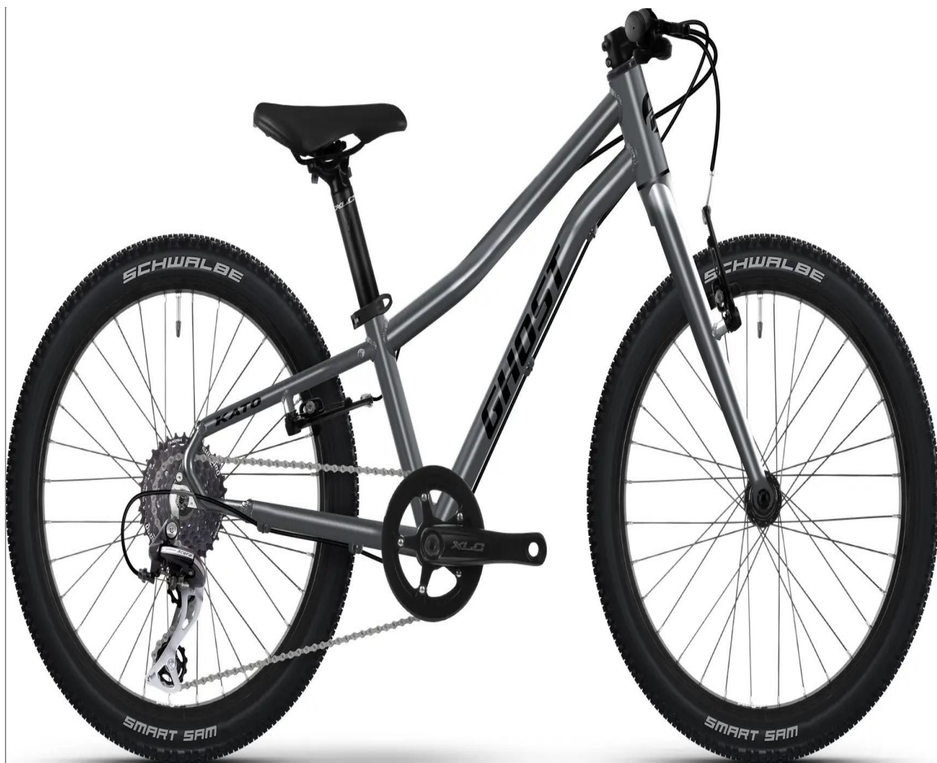
Ghost Kato 20 Pro - kolor szary