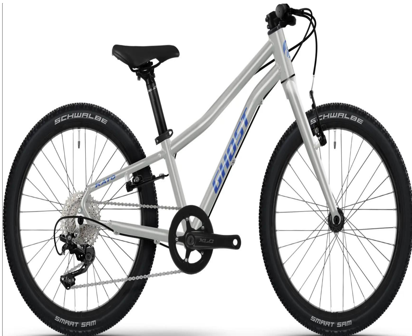
Ghost Kato 20 Full Party - kolor srebrny