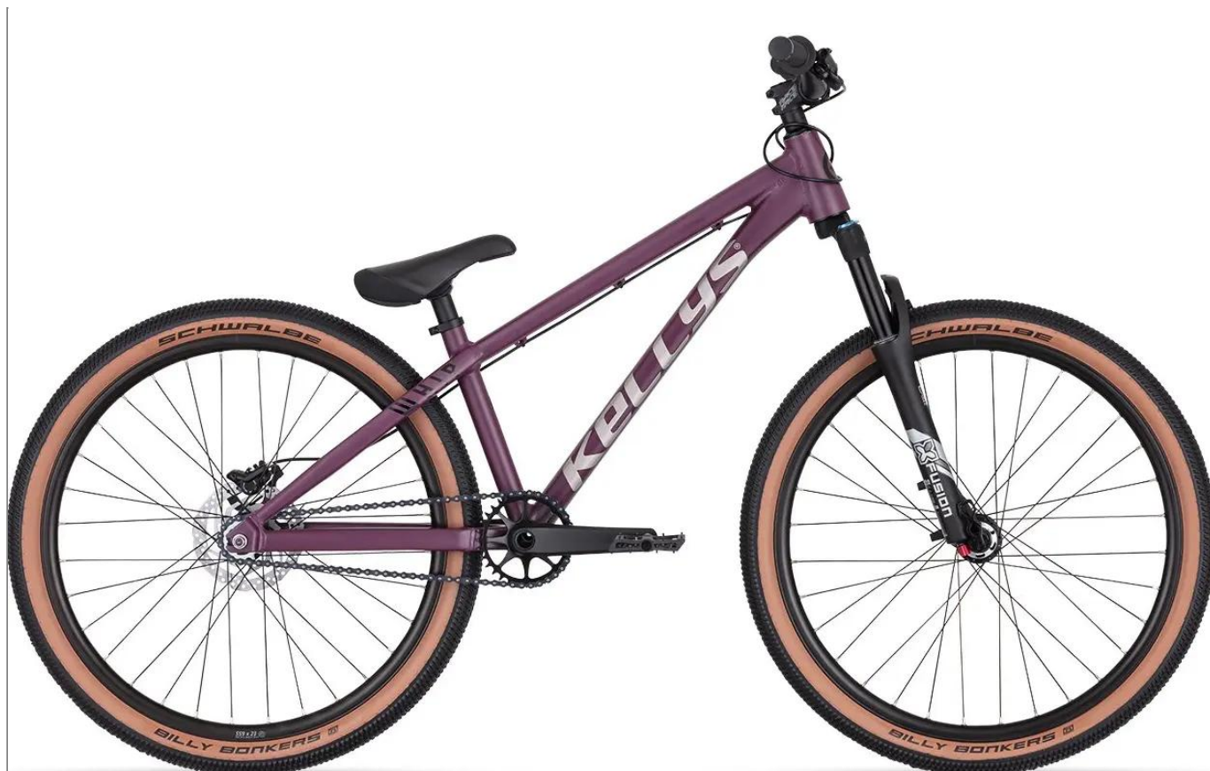
Kellys Whip 70 - Gotowy na loty