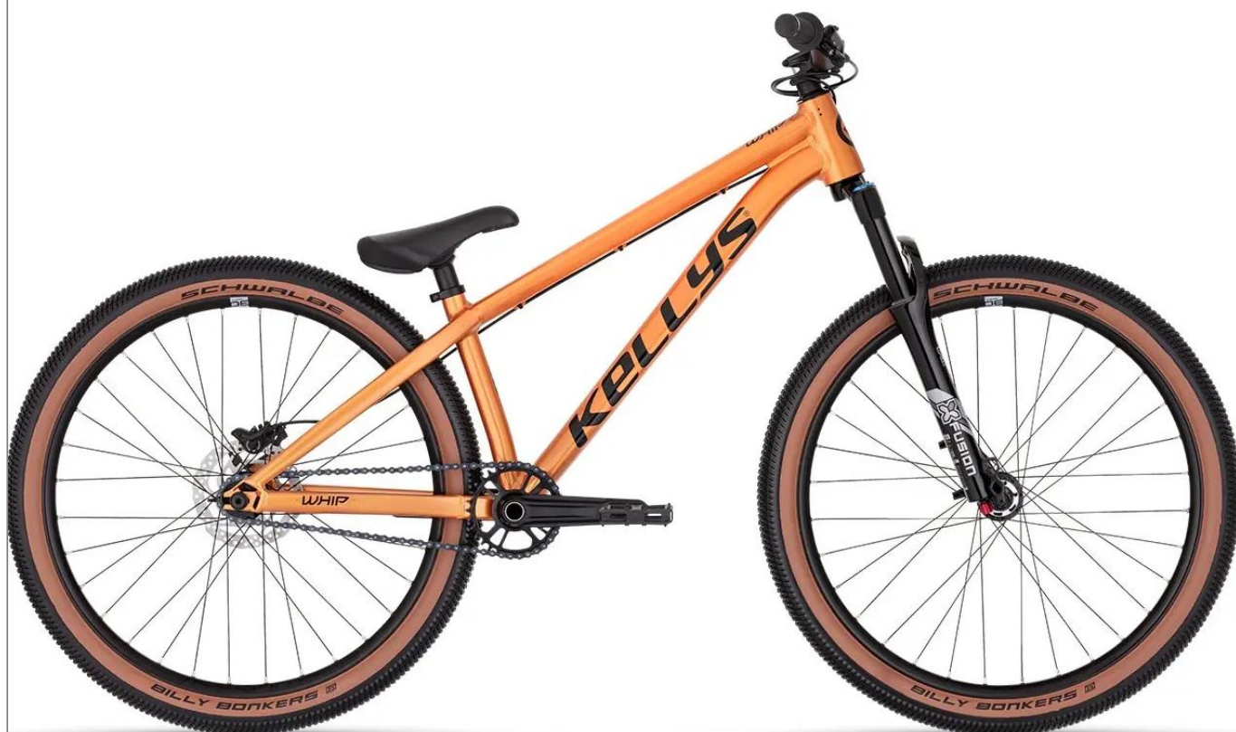
Kellys Whip 70 DJ - Gotowy na loty

Kellys Whip 70 to flagowy model do Dirt Jumpu, zbudowany na panczernej ramie z lekkiego stopu aluminium 6061. Progresywna geometria z ekstremalnie krótkim tyłem zapewnia błyskawiczną reakcję i łatwość wchodzenia w rotacje, czyniąc go idealnym wyborem na dirtsty i pumptracki.