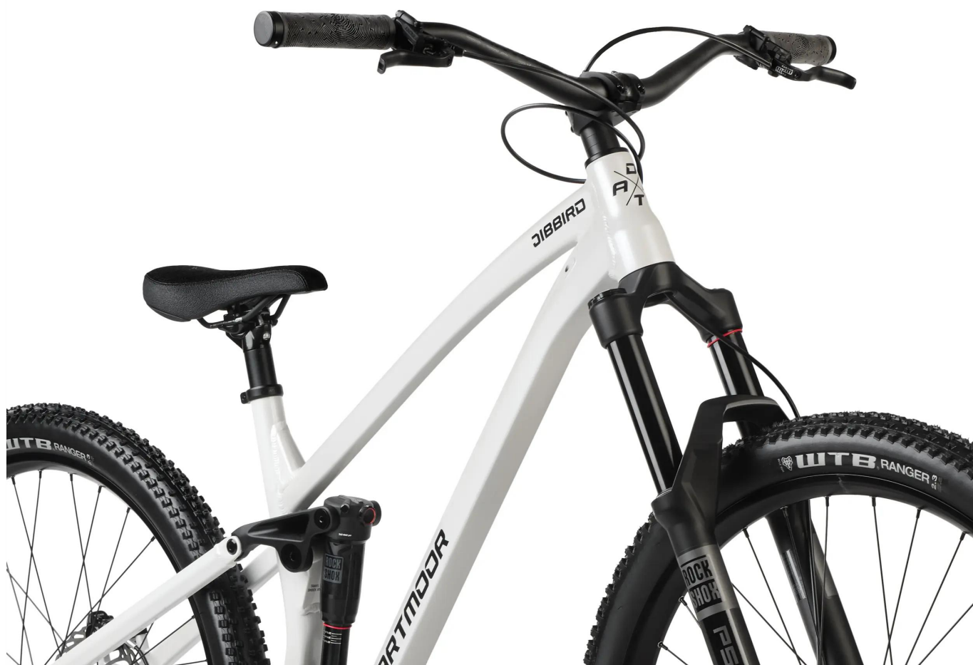
Kokpit przystosowany do barspinów