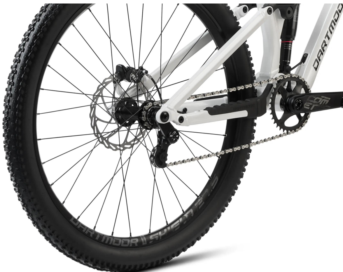
Krótkie ramiona korby FSA Comet (165mm)