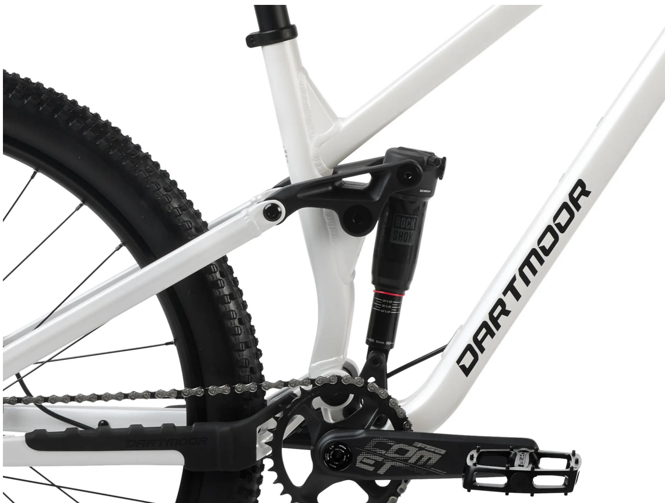
Powietrzny damper Rock Shox Deluxe Select