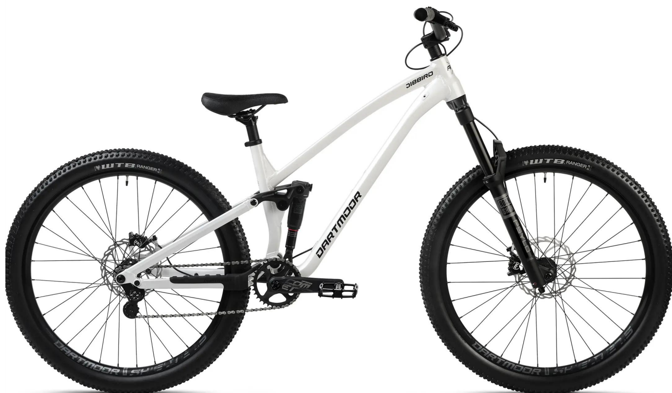
Agresywna geometria ramy Jibbird