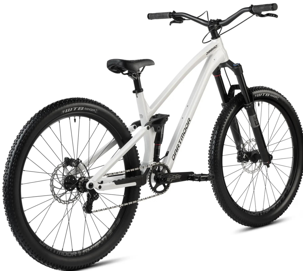
Pancerne obręcze Dartmoor Shield