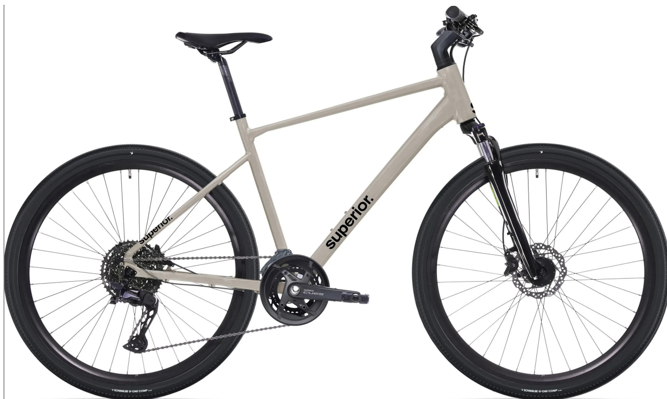
Superior Blox 6.5 MS - styl i uniwersalność