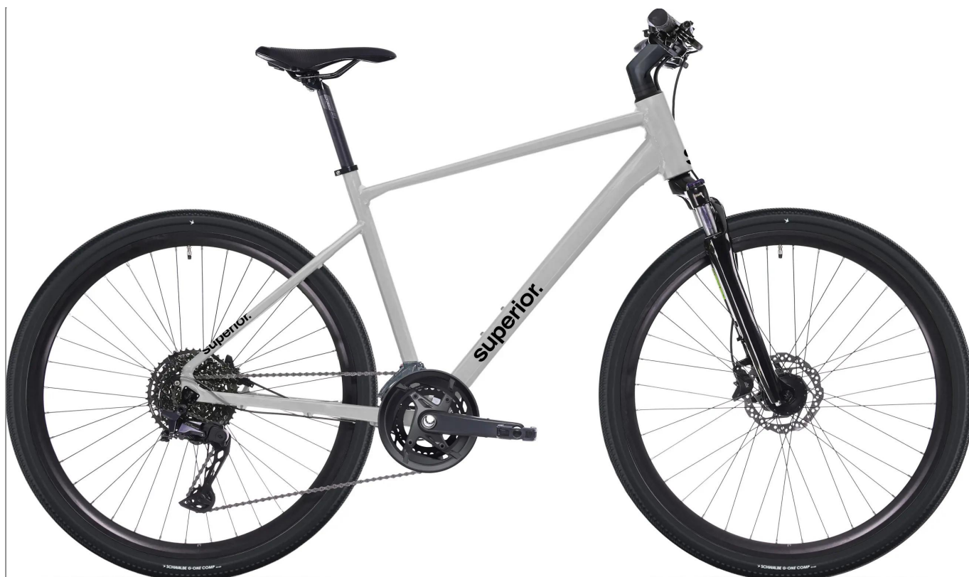
Superior Blox 6.2 – uniwersalna konstrukcja crossowa